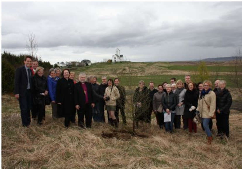
Að lokinni gróðursetningu í Skálholti.

verður lögð á að kynna Biblíuna og innihald hennar auk þess að fjölga meðlimum félagsins. Undanfarin ár hefur ekki verið fjármagn til að hafa framkvæmdastjóra á launum en vegna vinarbragðs og rausnarskapar félaganna á Norðurlöndum og hinna sameinuðu biblíufélaga, United Bible Societies , var hægt að ráða framkvæmdastjóra, sem hóf störf hinn 1. febrúar síðastliðinn og var skrifstofan flutt úr turni Hallgrímskirkju á Biskupsstofu. Vefur félagsins, biblian.is var uppfærður og geymir hann fjölda upplýsinga, texta Biblíunnar frá 2007, 1981 og Guðbrandsbiblíu.