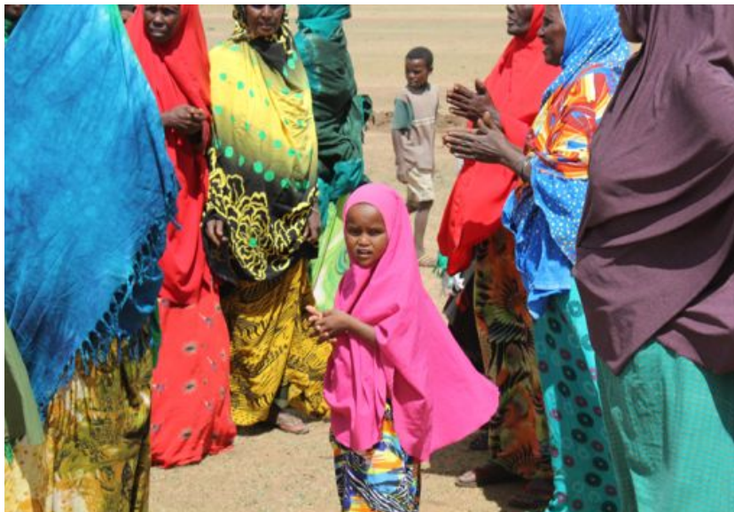
Í verkefninu í Eþíópíu er mikil áherslu á vald-eflingu kvenna og að bæta framtíðarmöguleika stúlkna.

alnæmi og búa ein eða sjúka foreldra og ömmur sem hafa barnabörn á framfæri. Áhersla er á að bæta lífsskilyrði þeirra með því að reisa handa þeim íbúðarhús með grunnhúsbúnaði og eldaskála með sérhönnuðum hlóðum sem spara eldsneyti og helstu áhöldum; auka á hreinlæti á heimilum með því að gera kamra og hreinlætisaðstöðu og fræða um samband hreinlætis og smithættu. Einnig á að auka aðgang að hreinu vatni með því að koma upp safntönkum. Upplýsingafulltrúi og framkvæmdastjóri fóru í eftirlistferð til Úganda í maí. Kostnaðaráætlun fyrir verkefnið árið 2014 er 142.000 EUR.