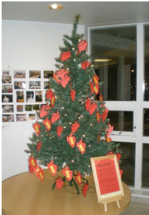
Englatréð í Grensáskirkju