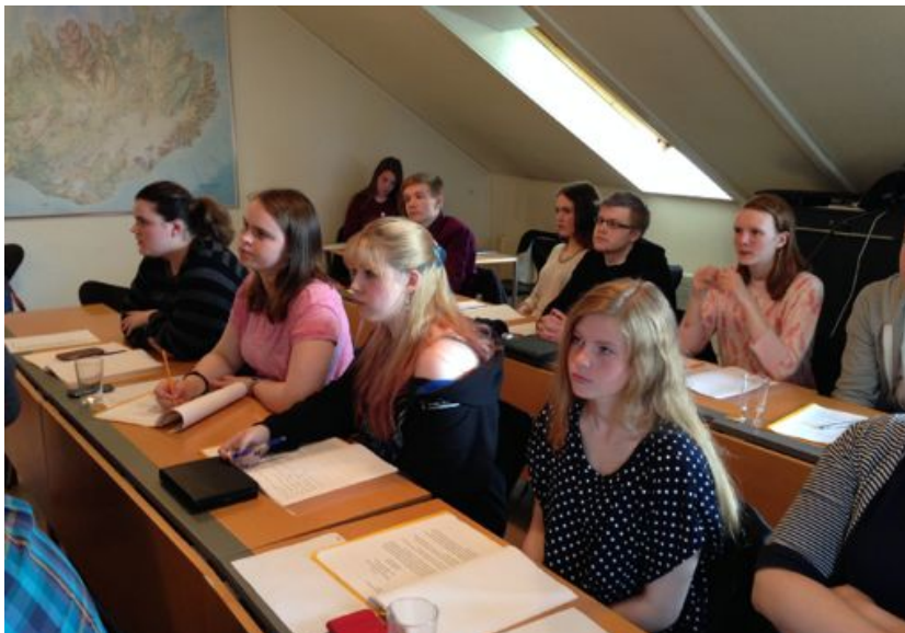
Kirkjuþing unga fólksins

Í kirkjunni kemur saman, undirbýr mál og velur þau mál sem helst á þeim hvíla með góðum fyrirvara. Við leggjum þetta til svo þingið geti betur starfað eftir þeim starfsreglum sem því er gert að gera.