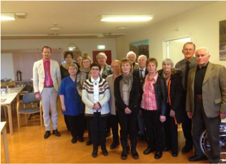
Kór Reykhólaprestakalls í Barmahlíðinni

messaði í Staðarkirkju en ekki komst hann til síns heima því sjóleiðin var ófær og var hann veðurtepptur í Aðalvík eina helgi í júlí. Ekki kom það að sök því þetta veitti prófastinum tækifæri til að skella sér á harmónikkuball í gamla skólhúsinu. Þar sá hann að nútíminn hefur haldið innreið sína að Sæbólí því nú er boðið þar upp á leigubíl; er þetta hálfur fólksbíll, sem festur er aftan í fjórhjól.