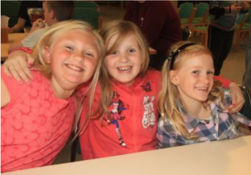
Hressar vinkonur í sumarbúðum.

og einnig lítið skógarjódur sem nýtist sem e.k. útikapella. Sumarbúðabörnin eru á aldrinum 7-14 ára í ólíkum aldursflokkum.