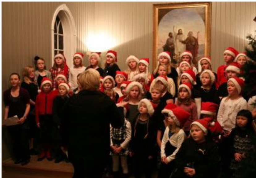
Aðventuhátíð í Sauðárkróskirkju.