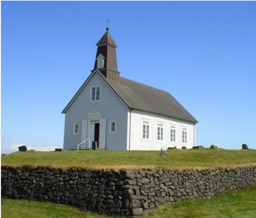
Strandarkirkja í Selvogi.

áform gætu styrkt rekstur staðarins. Kirkjuráð hefur unnið að málinu, einkum að samningsgerð við forsvarsmenn verkefnisins um bygginguna með hliðsjón af samþykktum kirkjupings. Unnið hefur verið að deiliskipulagi fyrir Skálholtsjörðina og þá fyrst og fremst á svæðinu þar sem dómkirkjan og Skálholtsskóli standa, auk fleiri bygginga. Ljóst er að kirkjan mun ekki taka fjárhagslega þátt í verkefni eða bera áhættu af því að öðru leyti en því að kosta gerð deiliskipulags. Áhugamenn um byggingu tilgátuhúss í formi menningarhúss í miðaldastíl í landi Skálholtsjarðarinnar ákváðu að hverfa frá áformum sínum að svo stöddu um síðla árs 2013. Verkefnið hefur aftur verið tekið á dagskrá og mun kirkjuráð vinna áfram að hugmyndinni ásamt áhugamönnum.