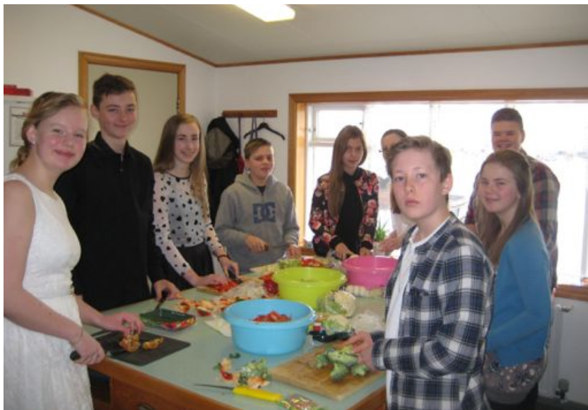
Fermingarár-gangurinn sér um veitingasölu á æskulýðsdaginn og styrkir um leið indverska stúlku sem prestakallið styður til náms.

sprauta sig og annað það sem fylgir því að lifa góðu lífi með svona sjúkdóm. Öll umgjörð og utanumhald er einstaklega fagmannlegt en um leið lífligt í meira lagi.