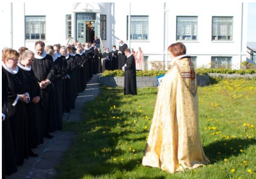
Við upphaf Prestastefnu 2014 á Ísafirði

Síðast var prestastefna haldin hér fyrir 35 árum, árið 1979, en þá voru nokkrir prestanna sem þjóna í dag, ekki fæddir. Þetta eru þó ekki einu skiptin sem Ísafjarðarkirkja hefur verið þéttsetin prestum. Árið 1925 var sá merki atburður