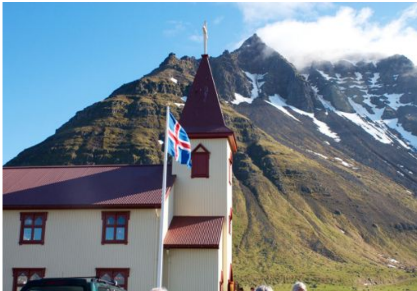
Hólskirkja í Bolungarvík

og afraksturinn verður kynntur hér á stefnunni. Mismunandi aðferðir voru notaðar við öflun efnisins enda prófastsdæmin mörg hver víðfeðm og langt á milli staða. Þetta gæti þó orðið einn liður í að kynna starf kirkjunnar betur.