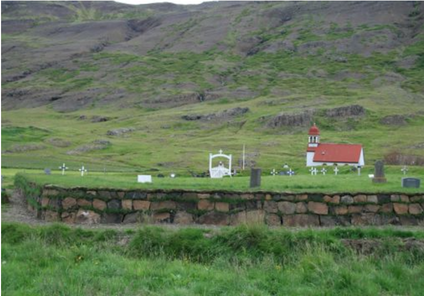
Kirkjugarðurinn í Gufudal

Kirkjugarðar Reykjavíkur: Vegna uppbyggingar í Kópavogskirkjugarði og duftgarðs í Leynimýri. Borgarnes: Lagfæring og stækkun garðs. Lundur: Ljúka hleðslu um kirkjugarðinn. Fáskrúðabakkasókn: Endurbætur á görðum sóknarinnar. Hellnar: Endurnýjun og stækkun kirkjugarðs. Stykkishólmur: Þökuleggja stækkun kirkjugarðs. Breiðabólstaður Skógarströnd: Greiða niður lán vegna framkvæmda við lagfæringu garðs. Gufudalur: Greiða niður bankalán vegna framkvæmda við garðinn. Súðavík: Endurnýja umgjörð kirkjugarðsins. Víðidalstunga: Bæta aðgengi og endurnýja girðingu. Keta: Endurnýja girðingu og þökuleggja garðinn. Goðdalir: Lagfæra innan garðs og þökuleggja garð. Dalvík: Lagfæringar af völdum snjóskemmda. Saurbær Eyjafirði: Endurnýjun á umgjörð kirkjugarðsins. Svalbarðseyri: Stækkun og lagfæring á núverandi garði. Póroddsstaður: Endurnýja umgjörð og endurtyrfa garð. Nes í Aðaldal: Stækkun og einhlaða vegg úr hraungrýti. Húsavík: Greiða niður skuld.