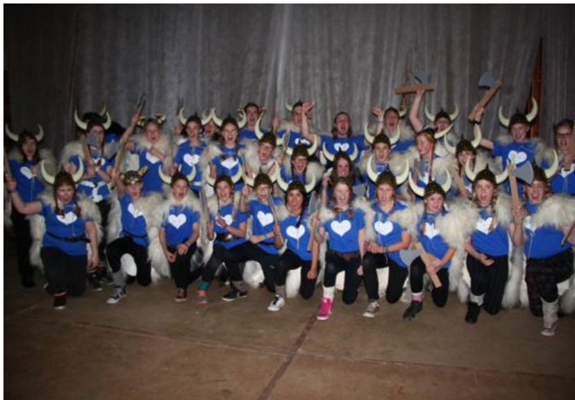
Búningakeppni á Landsmóti ÆSKP

vetur voru þó haldin tvönn sóknarnefndarnámskeið og stefnt var að því þriðja á Akureyri en í samráði við heimamenn var ákveðið að fresta því til haustsins.