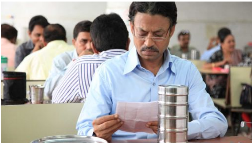
Skjaskot úr Nestisboxinu

Kvikmyndaverðlaun kirkjunnar eru styrkt af kirkjumálasjóði og hefur greinahöfundur haldið utan um þau. Ýmsir aðrir hafa lagt hönd á plóg í kvikmyndastarfi í kirkjunni. Sérstaklega ber að þakka framlag meðlima Deus ex cinema hópsins sem hafa lagt mikið af mörkum undanfarin ár.