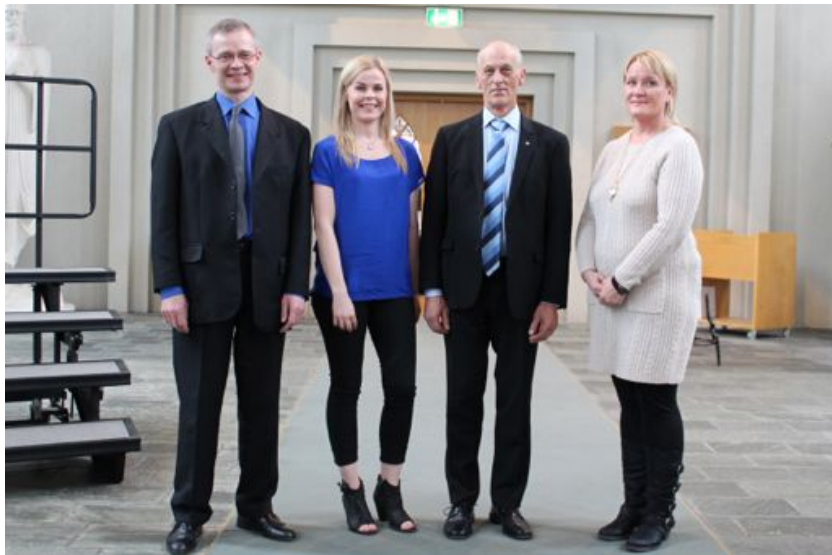
Frá útskrift Tónskólans í Hallgrímskirkju.