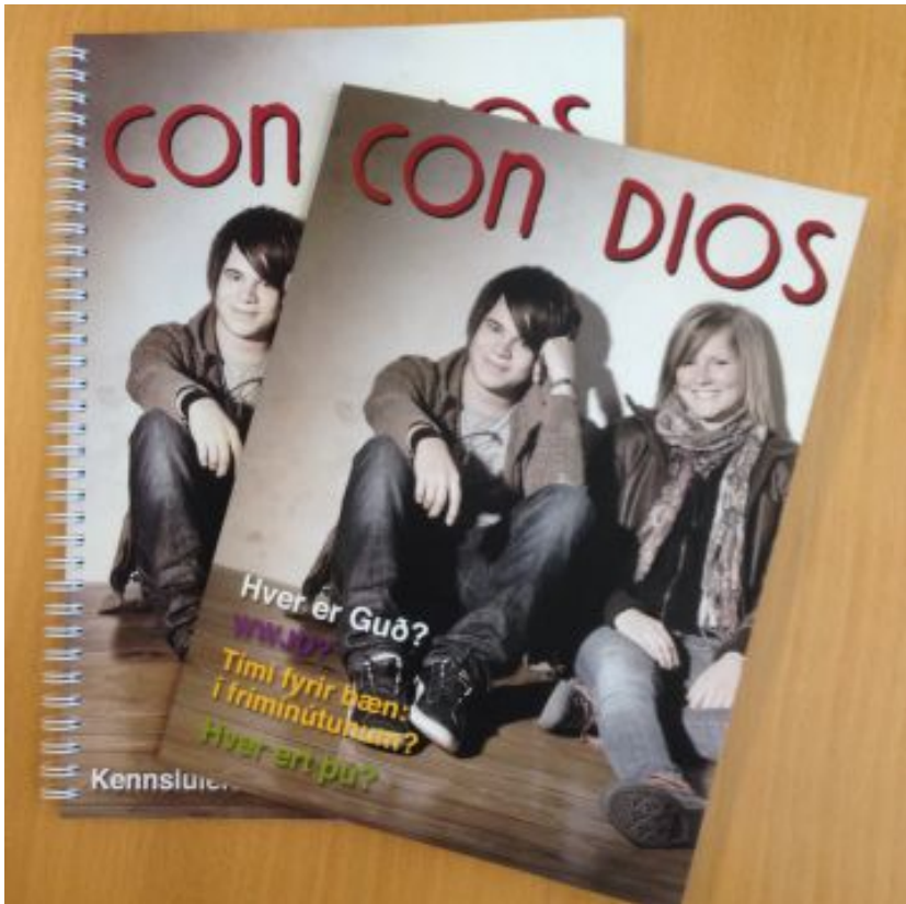
Nýja fermingarfræðslukverið, Con Dios