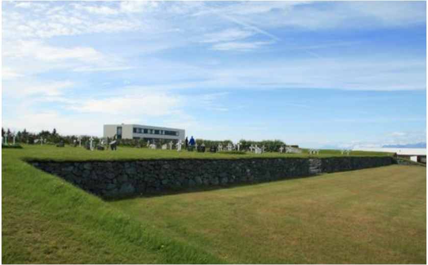
Kirkjugarðurinn á Höfn í Hornafirði

bindum lagt til skrif um kirkjugarðana og hefur framkvæmdastjóri ráðsins séð um þau skrif. Nú eru komin út 23 bindi og er stefnt að því að lokabindið sem jafnframt verður væntanlega númer 27 komi út árið 2016. Ritróðin Kirkjur Íslands er mikið stórvirki og hafa meira en 70 höfundar komið að verkinu. Þar er búið að safna á einn stað mikið af upplýsingum sem koma að góðu gagni fyrir alla þá sem áhuga hafa á sögu einstakra kirkjustaða og kirkna.