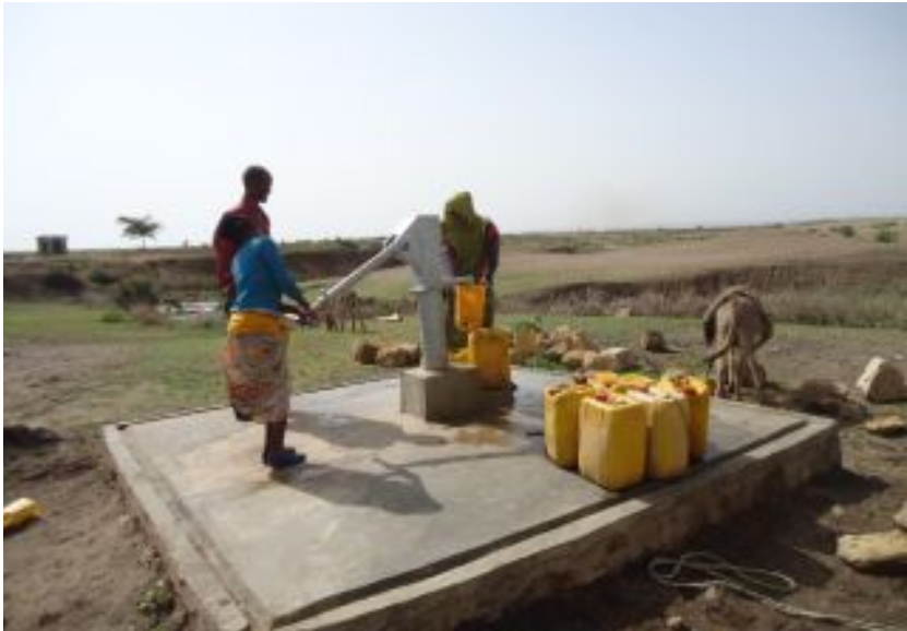
Nýr brunnur í Beyio í Jijiga-héraði í Eþíópíu.

Malaví og Úganda undir yfirskriftinni „Hreint vatn bjargar mannlífum“. Valgreiðslur voru sendar í heimabanka landsmanna um miðjan apríl.