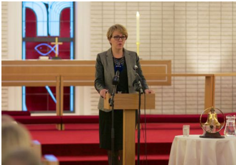
Hanna Birna Kristjánsdóttir, innanríkisráðherra

Það er oft talað um að eiga sér barnatrú. Sú trú er að mínu mati mikilvægari en flest annað. Þannig má aldrei vanmeta þær minningar og tilfinningarnar sem tengjast því að eiga trú sem barn og eiga að fylgja okkur alla ævi. Kærleikurinn er kjarninn í kristinni trú og með kærleikann að leiðarljósi stígum við mörg skref í átt að betra samfélagi.