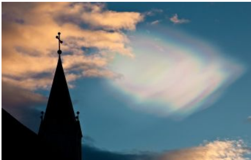
Glitský yfir Sauðárkróskirkju