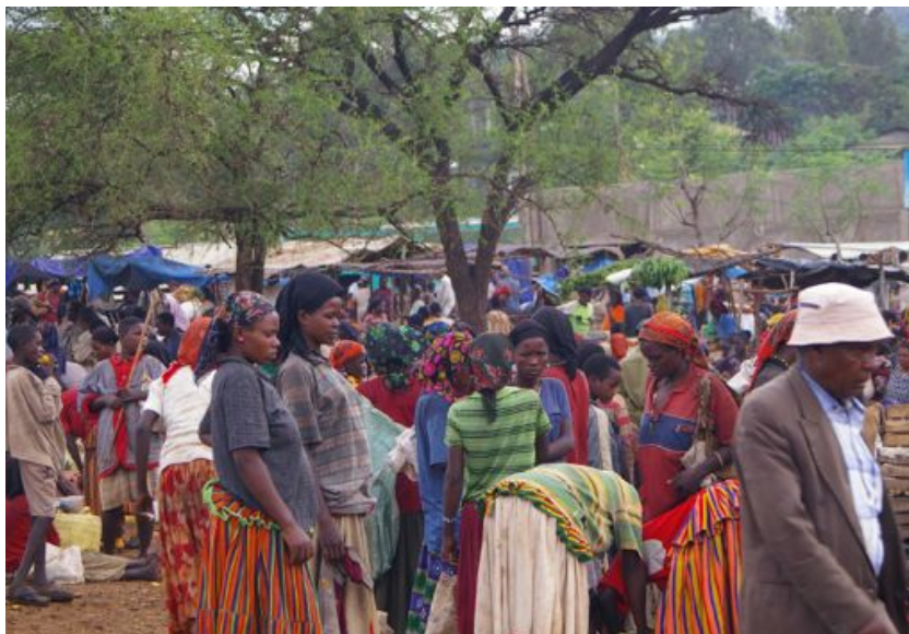
Markaðsdagur í Konsó, Eþíópíu.