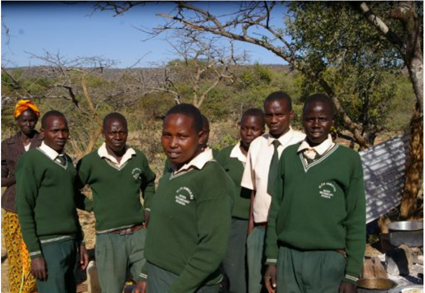
Nokkrir af nemendum Embo Asis Secondary School, Pókothéraði, Keníu.