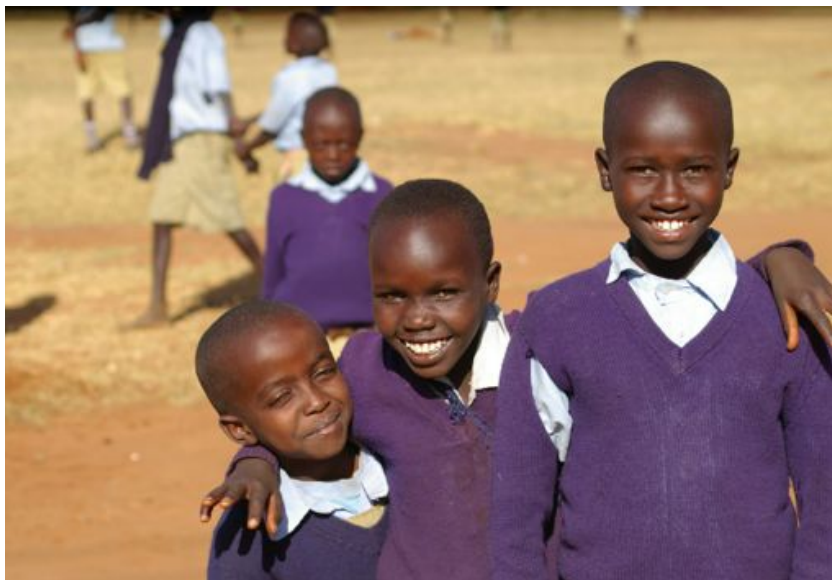
Nemendur við grunnskólann í Chepareria, Pókóthérðaið, Keníu.

barna, fermingarbarna, eldri borgara og í guðsþjónustum. Kristniboðssambandið fær styrk úr kirkjumálasjóði upp á tvær milljónir króna. Samskot til starfs okkar eru tekin reglulega í Grensáskirkju og Hallgrímskirkju í Reykjavík og við allar Tómasarmessur í Breiðholtskirkju en SÍK er í samstarfi um þær. Mörg prófastsdæmanna styrkja okkur og er framlag Reykjavíkurprófastsdæmis eystra myndarlegast eða 400 þúsund krónur á liðnu ári. Einnig hafa margir söfnuðir þjóðkirkjunnar stutt starfið en mest komið frá Hallgrímskirkju og Grensáskirkju m.a. vegna samskota. Á heildina litið hefur þó dregið nokkuð úr stuðningi prófastsdæma og sókna eftir bankahrúnið 2008.