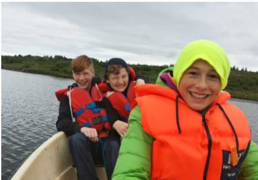
Sumarbúðastrákar í skemmtilegri bátsferð á Eiðavatni.