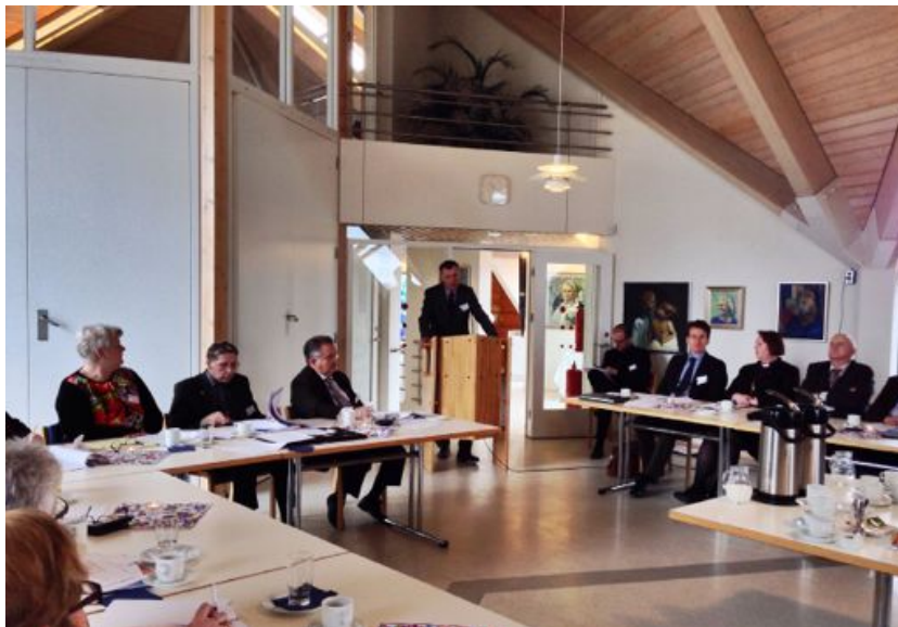
Frá Leikmannastefnu 2014